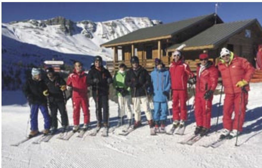
Commission de sécurité du début de saison

fois, sur la partie de droite en descendant la piste. Enfin, la musique, en test 2 mois l'an dernier, sera présente tout au long de la saison sur le Park de l'Eyssina, avec la possibilité de passer vos musiques préférées ! Bien entendu, nous avons réalisé de nombreuses améliorations électriques et techniques