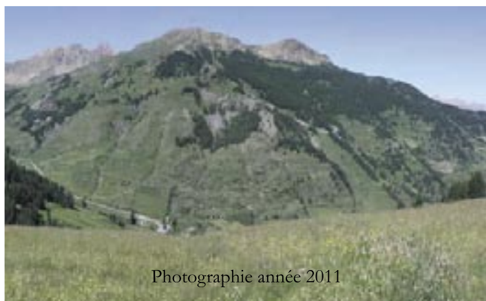
Photographie année 2011