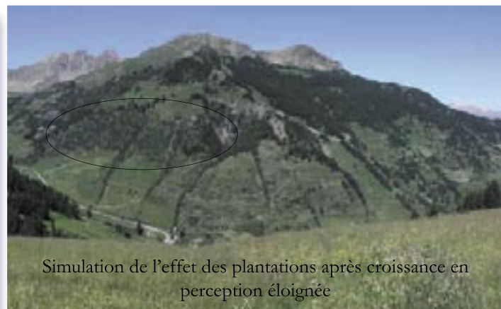
Simulation de l'effet des plantations après croissance en perception éloignée