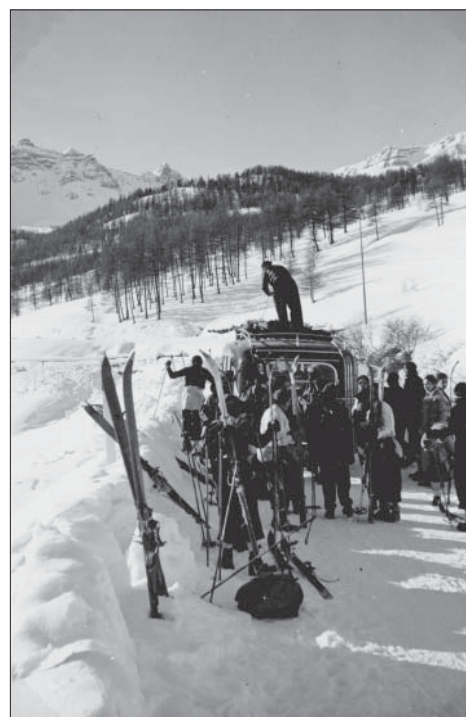
L'enneigement aux Plans - Noël 1937

En effet, le télé-auto-ski du Présés (près du refuge) dont le premier tronçon était prévu pour décembre 1937, ne fut exploité qu'à partir de février 1939. Le second tronçon fut installé peu de temps après par des habitants du village de Sainte Marie. Suite aux dégradations dues aux vols et aux intempéries, les appareils furent transportés dès 1940 dans un hangar à Mont Dauphin, alors que les câbles étaient stockés dans le refuge Napoléon. Ils furent finalement détruits par les troupes d'occupation. S'en suit une série d'investissements, à Noël 1958, la station comptait environ 330 touristes, logés presque exclusivement en hôtel, alors qu'à Noël 1960, la station hébergeait près de 1 100 touristes. Le centre touristique se situe à cette époque à Sainte-Marie, qui était pourtant jadis le village le moins peuplé de la Commune.