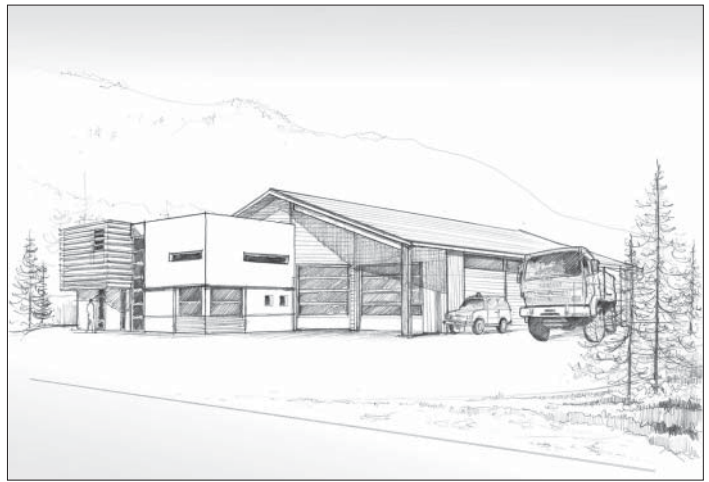
Croquis de la future caserne de Vars

En France moins de 10 % de la population est formée à ces gestes de base qui peuvent sauver des vies, alors que dans certains pays les initiés représentent parfois jusqu'à 70 % de la population. Les pompiers saluent l'initiative du personnel enseignant sur la démarche du projet d'école et leur apporteront une aide technique avec des interventions dans les classes. Les personnes intéressées par cette formation peuvent se former auprès des organismes de secours. Les pompiers de Vars, organisent la formation à partir d'un groupe de huit personnes.