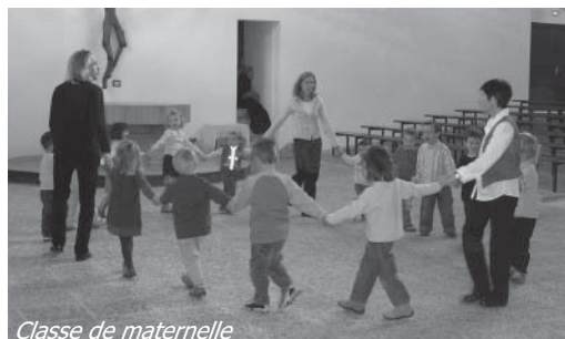
Classe de maternelle

Nous espérons un exposé des petits Varsincs lors de la journée des résidents qui aura aussi pour thème l'eau.